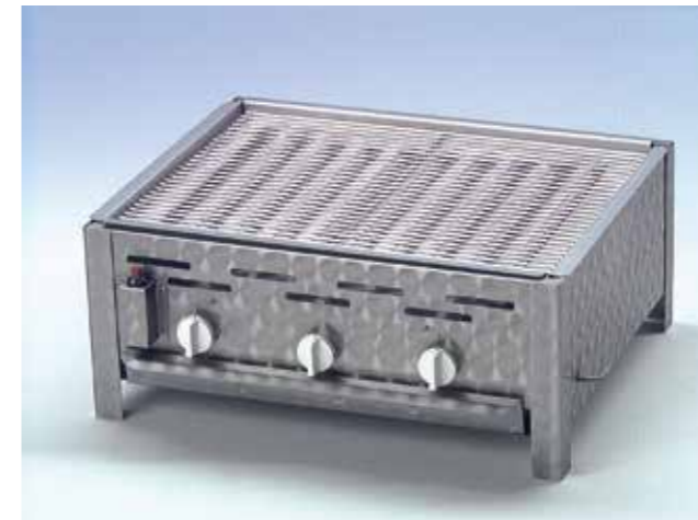
Grilli 3 polttimella ja lisävarusteilla: grillausritilä, polttimen suojakansi ja rasvanpoistoallas