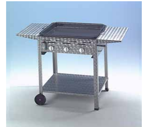
Grilli 3 polttimella ja lisävarusteilla: mobiilit jalat (välipohja, 4 jalkaa, 2 kahvaa, 2 pyörää), sivutasot ja emalipannu