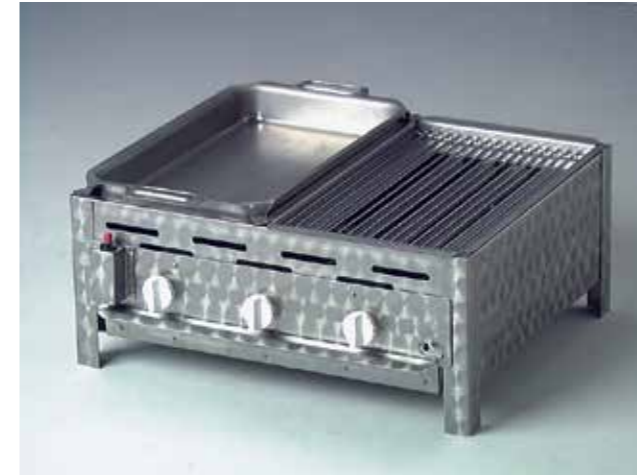
Grilli 3 polttimella ja lisävarusteilla: pannu- ja grillausritiläyhdistelmä

Tässä muutamia esimerkkejä laajasta tuotevalikoimastamme. Gastrogrillejä voi ongelmitta laajentaa ja näin saat paljon enemmän irti grillistäsi. Tukijalat, perusmallina tai mobiilina, sivutasot, roiskesuoja, wokkipannu jne... – meiltä saat kaiken kerralla, sopivan kokoisena ja parhaalla laadulla.