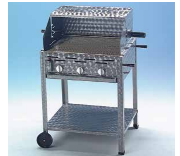
Grilli 3 polttimella ja lisävarusteilla: mobiilit jalat (välipohja, 4 jalkaa, 2 kahvaa, 2 pyörää) ja tuulisuoja sekä grillivarras.