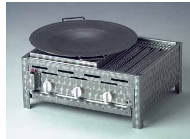
Grilli 3 polttimella ja lisävarusteilla: wok-setti: wokkipannu, adapteri ja grillausritilä (käyttö ainoastaan polttimien suojakannen kanssa)